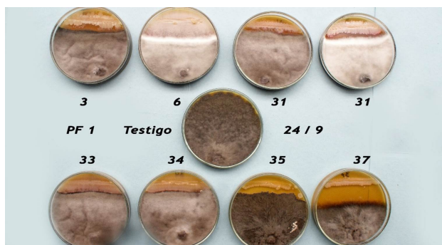
Figura 1. 3. B. subtilis (Bs-4), 6. B. subtilis (Bs-21), 31. Aislado 14 Bacillus spp. 33. Aislado E1 Bacillus spp. 34. Aislado E5 Bacillus spp. 34. Aislado E6 Bacillus spp. 37. B. subtilis (98,2) vs M. phaseolina

Sin embargo, se registró que cuando la población bacteriana creció en exceso (figura 1, placas 6 y 31; figura 2, placas 3, 6, 34, 35 y 37) la zona de inhibición fue menor y el hongo mostró una coloración blanca. Esta observación se explica por el probable agotamiento de los recursos disponibles en el medio de cultivo, en particular las fuentes de carbono y nitrógeno de fácil acceso. Ante esta escasez, es posible que la bacteria entrara en una fase estacionaria o de declive, detuviera la producción de metabolitos secundarios y cambiara su metabolismo hacia la simple supervivencia, y entonces el hongo fitopatógeno como posee una alta competencia como organismo saprófito, pudo haber secretado enzimas que digirieron las bacterias muertas o moribundas y utilizara sus componentes como fuente de alimento. Esto coincide con lo informado por Castañeda y Sánchez (2016) quienes evaluaron el crecimiento de cuatro especies de Bacillus spp. como primer paso para entender su efecto de control sobre Fusarium sp.