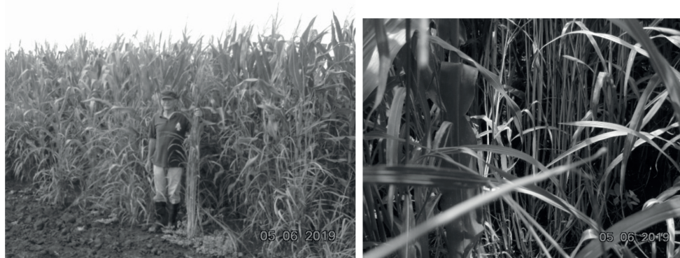
Figura 3. Estado de desarrollo de R. cochinchinensis en la vt (St), en Güira de Melena, 2019 a los 70 días de la aplicación.

este tratamiento; obsérvese el nivel competitivo por la alta población, el desarrollo y el número de tallos en la hilera de maíz (Fig. 3).