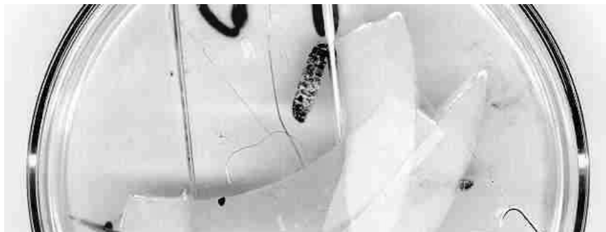
Figura 1. Larva momificada de Galleria mellonella en cámara húmeda infectado con el aislado Ma-30 de Metarhizium anisopliae a partir de muestra de suelo. Nótese la emersión temprana del micelio en blanco.

metabolitos activos afecten la viabilidad de estos propágulos fúngicos deseados [Jenkins y Grzywacz, 2000]. Por ello, el trapeo puede fallar si no existe una concentración alta de esporas viables del microorganismo de interés en el suelo