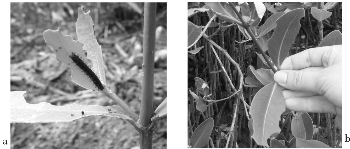
Figura 1. Daño foliar en los márgenes de las hojas de árboles plantados (a) y de regeneración natural (b) de A. germinans en el manglar del ejido Las Coloradas, Ampliación Las Aldeas, Cárdenas, Tabasco.

de árboles de manglar no se relaciona con el daño que ocasiona la herbivoría. La especie Anacamptodes sp., que constituyó una plaga defoliadora en 1995 y 2010, también presenta el patrón de consumo que se reporta; sin embargo, dicha especie tiene un comportamiento voraz debido a que consume toda la hoja, dejando solo las nervaduras de las mismas e interfiriendo en los procesos de fotosíntesis, transpiración y translocación de los nutrimentos de los árboles debido a que puede causar defoliación total [INE, 2000].